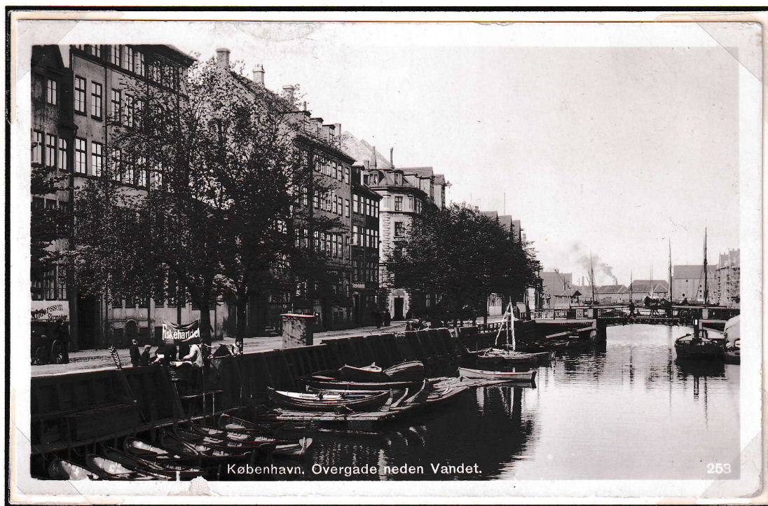
Christianshavn, Ovengaden neden vandet.

(Posthuset havde adresse i nr.25 på denne gade fra 1869 til 1871).