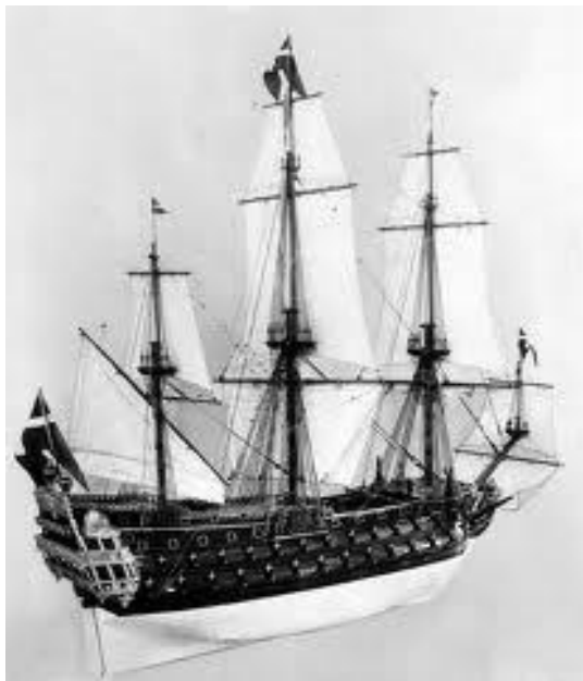
Figur 1 Model af Christianus Quintus