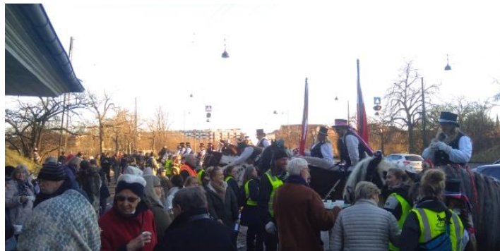
Vi byder på et lille glas Amager Punch

18. februar: Fastelavnsryttere fra Amager kommer til Vagthuset omkring kl. 16.