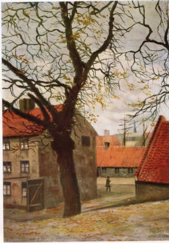
Helms Huse. (Oregards Museum.)