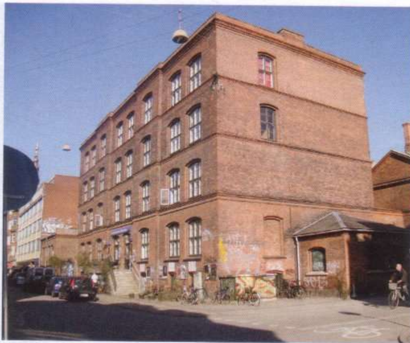
Dronningensgade skole, Christianshavn skole

Fra 1894 til 1915 hed skolen Dronningensgade friskole, og fra 1915-1938 Dronningensgade kommuneskole.