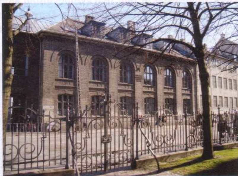
Christianshavn skole, filialen

Skolebygningen ud til Prinsessegade 54 (i 1913 nummerskifte fra 44) blev opført for Københavns kommune, indviet og taget i brug 14.- henholdsvis 15. august 1865 og i starten benyttet som betalingskole. Der var 9 klasseværelser samt et større værelse eller sal bestemt til undervisning i tegning og sang.